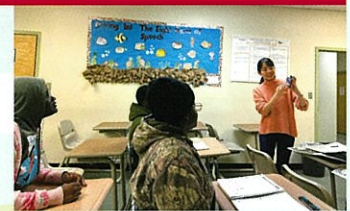
Primary Teacherとして担当した日本語の授業

高校教員経験5年を経て、1年の休職期間でFLTAの経験をしたことは、一生分の価値がありました。世界中の人と繋がることができたことはかけがえのない財産です。