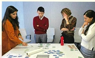
デザイン会社でのインターン風景

フルブライト奨学金はインターネット検索で知りました。退職し、家族を連れて留学するには、奨学金なしでは金銭的に厳しい状態でした。フルブライト奨学金は学費と生活費が手厚いという魅力に加え、フルブライターのネットワークが強いと知り、その仲間に入りたいというのが大きなモチベーションになりました。