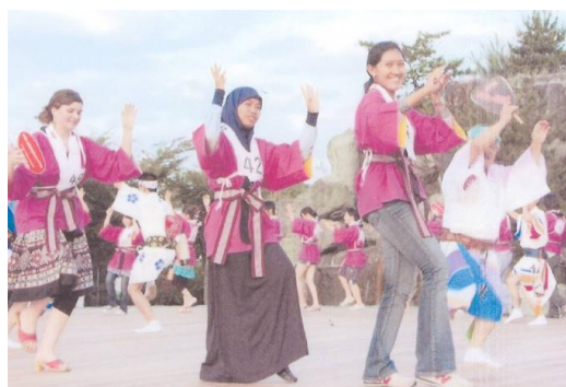
外国人阿波踊りコンテスト