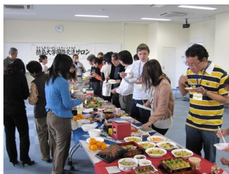
国際交流サロン:世界の料理