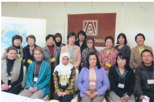
インターナショナルナイト