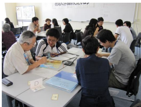
国際交流サロン:日本語で話そう