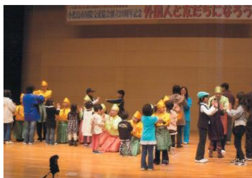
外国人と友だちになろう！