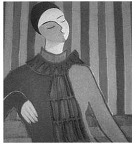
出捐者 戸部 眞紀 作